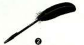
2 Kugelschreiber mit Gänsefeder, von Maison Margiela, um 55 Euro