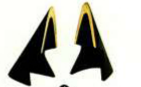
4 Skulpturale Buchstützen von Carl Auböck, um 530 Euro