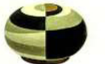
3 Aufbewahrungsbox im Stil des Kubismus, von L'Objet, um 340 Euro