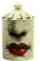
5 Dufikerze mit Keramikkorpus, von Fornasetti, um 155 Euro