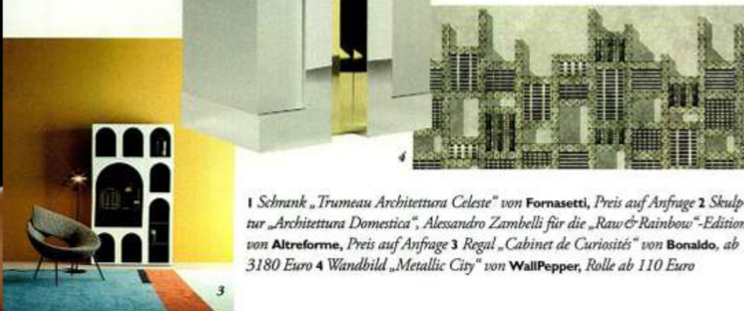
1 Schrank „Trumeau Architettura Celeste“ von Fornasetti, Preis auf Anfrage 2 Skulptur „Architettura Domestica“, Alessandro Zambelli für die „Raw & Rainbow“-Edition von Altreforme, Preis auf Anfrage 3 Regal „Cabinet de Curiosités“ von Bonaldo, ab 3180 Euro 4 Wandbild „Metallic City“ von WallPepper, Rolle ab 110 Euro

NEU-BAUTEN Schränke, Teppiche, Tape- ten und Designobjekte zitieren jetzt oft Elemente der ARCHITEKTUR – ein SPIEL mit klassischen Formen und Panoramen, verfremdet und verklei- nert: Trompe-l'Œil mit einem Hauch von Ironie.