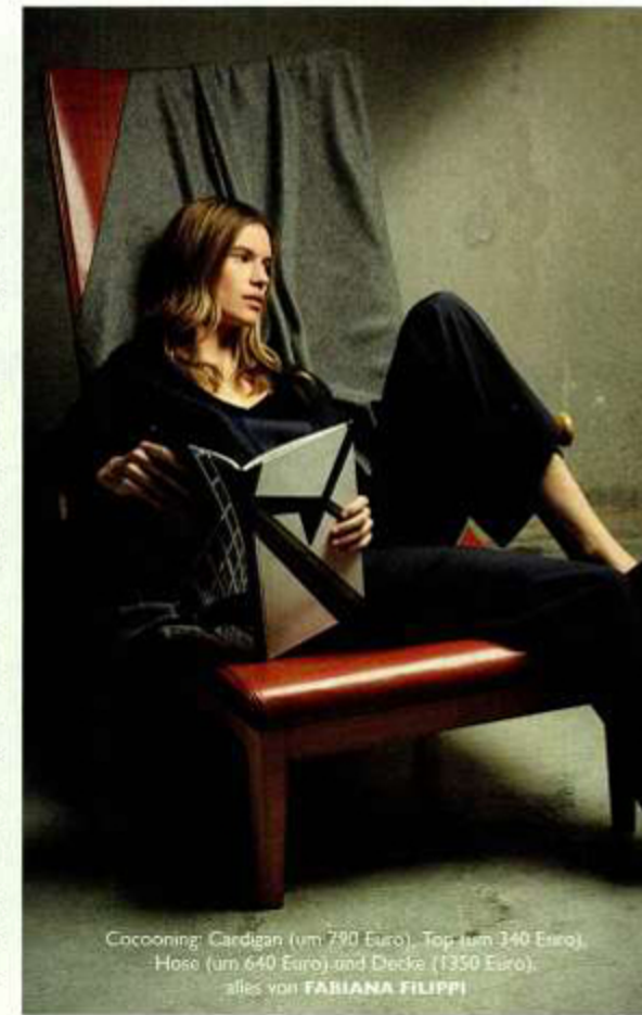
Cocooning: Cardigan (um 790 Euro), Top (um 340 Euro), Hose (um 640 Euro) und Decke (1350 Euro), alles von FABIANA FILIPPI