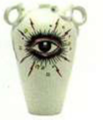
1 Porzellanvase „Star Eye“ von Gucci, um 2980 Euro

AUGENSCHMAUS: DAS HOMEWEAR-STUDIO VON MATCHSEFASHION.COM